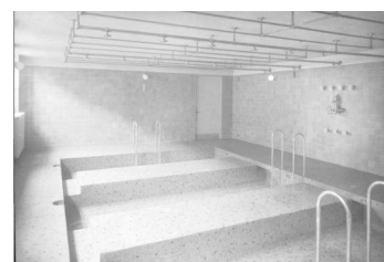
Archives de Strasbourg, Inventaire n° 131 MW 1679, sans date.

Finissons avec les vestiaires de cette fameuse piscine. Vous ne les avez pas remarqués? Regardez sous le bâtiment C.