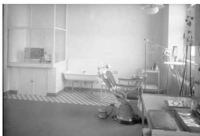
Archives de Strasbourg, Inventaire n°131

Que nous diriez-vous si on vous affirmait qu'il y avait un cabinet de dentiste ? Oui oui, regardez cette photo :