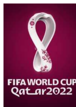
Le logo officiel.

Par contre, le prince d'Arabie Saoudite a promis une grosse récompense à tous les vingt-six joueurs de l'équipe saoudienne suite à leur victoire contre l'Argentine (2-1). En effet, le prince héritier, Mohammad bin Salman al-Saudq, leur offre à chacun une Rolls-Royce Phantom, d'une valeur de 500.000 euros.