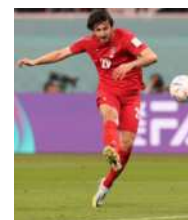
L'attaquant iranien Sardar Azmoun.

national, ils emprisonneraient leurs familles. Ils ont donc chanté leur hymne. L'Iran a tout de même été éliminé de son groupe, car ils n'avaient pas assez de points pour se qualifier en 8 e de finale.